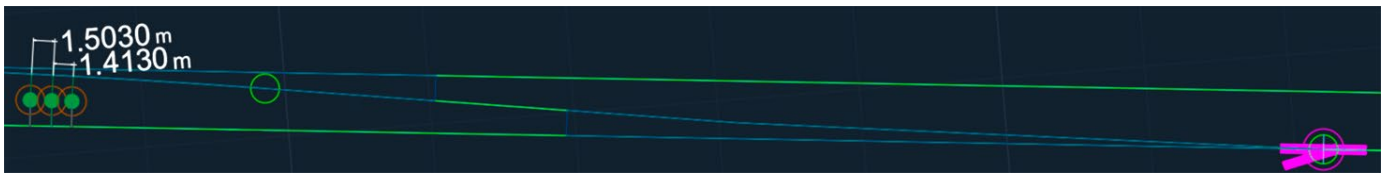
Bild 1: Differenzen berechneter Grennzeichenpositionen bei einer Weiche mit Öffnungswinkel 1:18 und angesetztem Gleisabstand von 3,50 m, 3,55 m und 3,60 m; beispielhafter Screenshot aus ProSig® EPU

Fig. 1: The differences in the calculated fouling point positions for a switch with an opening angle of 1:18 and a track spacing of 3.50 m, 3.55 m and 3.60 m; an example screenshot from ProSig® EPU